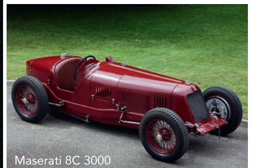
Maserati 8C 3000