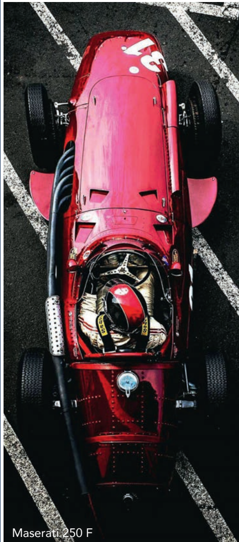
Maserati 250 F

Ein Shuttlebus wird uns am Samstagabend nach dem Feuerwerk vom Nürburgring zum Hotel und am Sonntagmorgen vom Hotel zum Ring bringen.